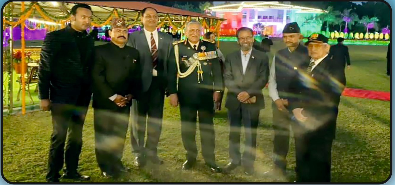
उत्तराखण्ड राज्यको स्थापना दिवसको अवसरमा सभाका प्रतिनिधिहरु Gen Bipin Rawat CDS सित