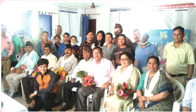
भारूवाला ग्रांट शाखा