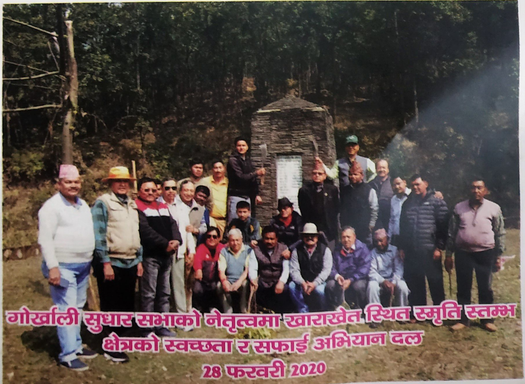
गोर्खाली सुधार सभाको नेतृत्वमा खाराखेत स्थित स्मृति स्तम्भ क्षेत्रको स्वच्छता र सफाई अभियान दल 28 फरवरी 2020

नमक सत्याग्रह-डांडी से खाराखेत, देहरादून स्मृति स्तम्भ - खाराखेत