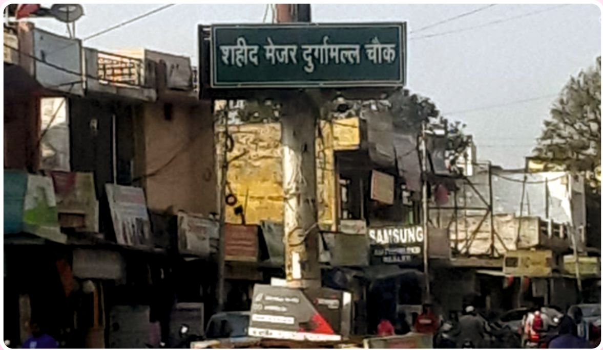
शहीद मेजर दुर्गामल्ल चौक, डोईवाला