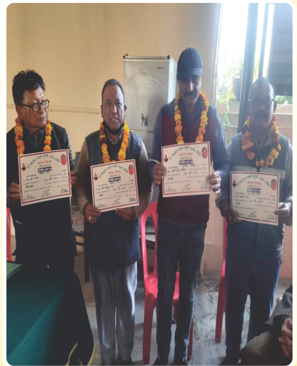
सिद्धेश्वर महादेव मंदिर केदारपुर मोथरोवाला रोड देहरादुनको नवनिर्वाचित कार्यकारिणी