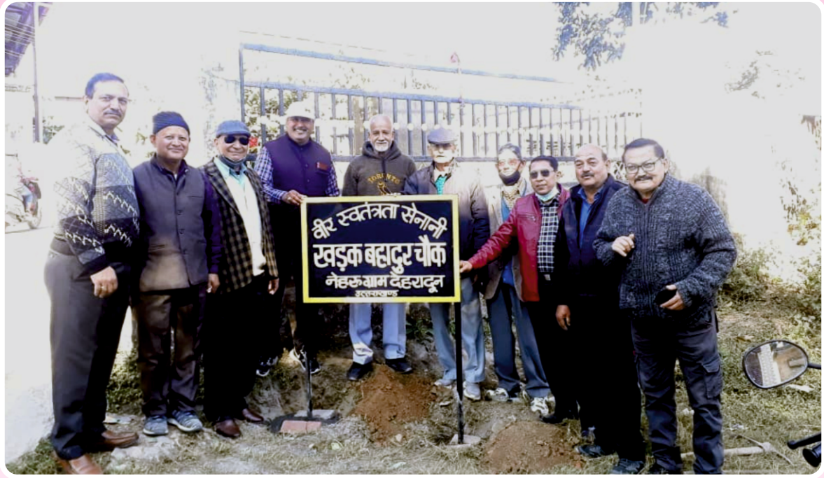
नेहरूग्राम गोर्खा विकास संस्था द्वारा स्थापित वीर स्वतंत्रता सेनानी खड़क बहादुर चौक नेहरू ग्राम देहरादून, उत्तराखण्ड