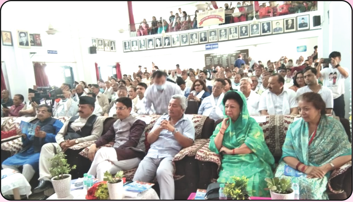
17 अप्रैल 2022, स्थापना दिवस समारोह, गोर्खाली सुधार सभा