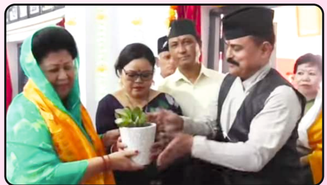
स्थापना दिवस समारोह