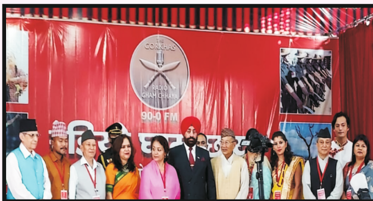
रेडियो घामछाँयाको टीम माननिय राज्यपालसित उद्घाटनको उपलक्षमा