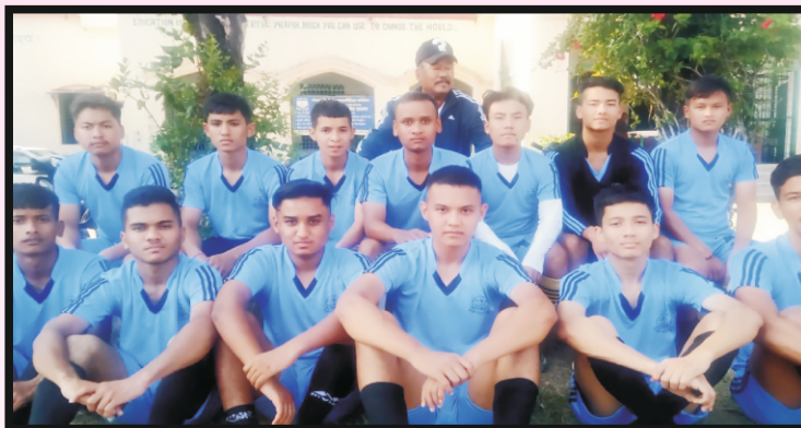
फुटबल महाकुंभमा गोर्खाली सुधार सभाको फुटबल टीम