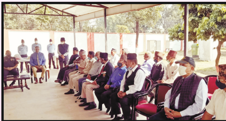
गोर्खाली सुधार सभाको शाखा अध्यक्षहरु GOC UK Sub Area सित